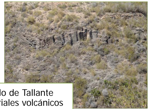
Hábitat del Garbancillo de Tallante caracterizado por materiales volcánicos

A nivel mundial, el Garbancillo habita en estos enclaves volcánicos próximos a Tallante y Los Puertos de Santa Bárbara: