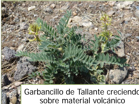
Garbancillo de Tallante creciendo sobre material volcánico