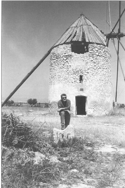
Foto 6. Molino Zabala.