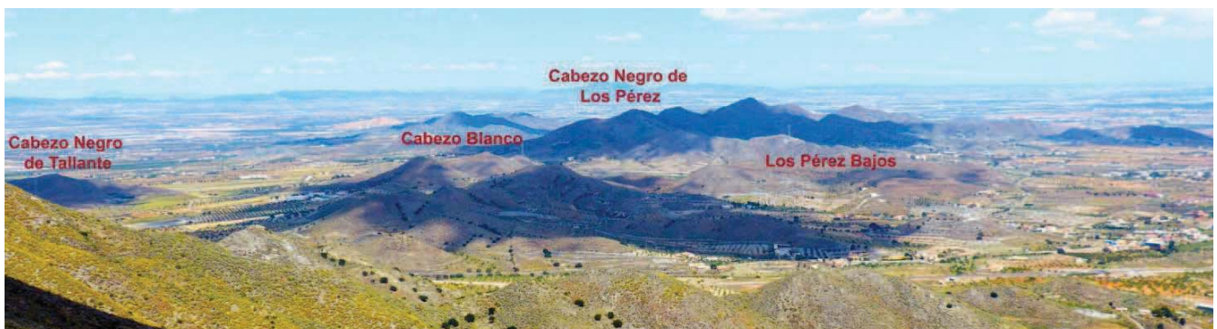
Gráfico 2. Vista panorámica de ubicación de las poblaciones de Astragalus nitidiflorus