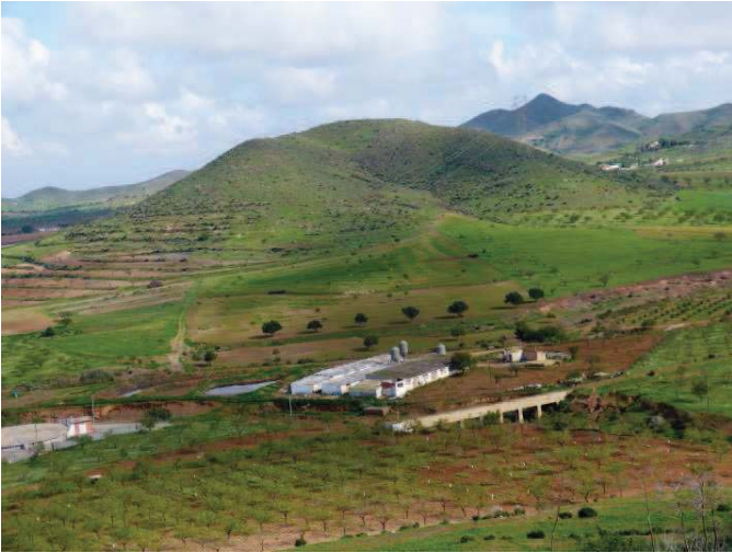
Foto 3. Vista del Cabezo Negro de Tallante

consiste en basaltos alcalinos con pequeñas cristalizaciones de olivino, augita y hornblenda, los cuales únicamente se encuentran en Marruecos, Mar de Alborán, Campo de Calatrava, Levante y los macizos Central francés, Renano y Bohemia.