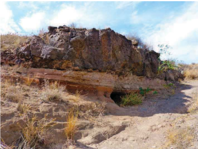
Foto 4. Corte geológico de terreno volcánico

Cercano al Cabezo Negro de Tallante se encuentra una estructura con un alto interés Geológico que pone de manifiesto la violencia de las erupciones, así como el espesor de las coladas de lava resultantes y los piroclastos expulsados durante la misma.