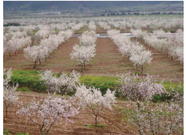
Foto 5. Vista de almendros en flor en Tallante

Se sospecha que la presencia de Astragalus nitidiflorus en determinadas zonas volcánicas se debe al uso agrícola que se mantuvo en el terreno, dado que existe una fuerte correlación entre la presencia del Garbancillo de Tallante y los márgenes de cultivos abandonados. La fuerte presión que existía en aquellos pequeños agrosistemas, impidió la aparición de especies invasoras y malas hierbas, y al cesar dicha perturbación pudo asentarse el Garbancillo sin competidores en el medio.