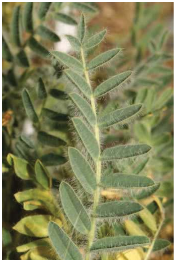
Foto 2. Detalles de las flores y de una hoja de Astragalus nitidiflorus