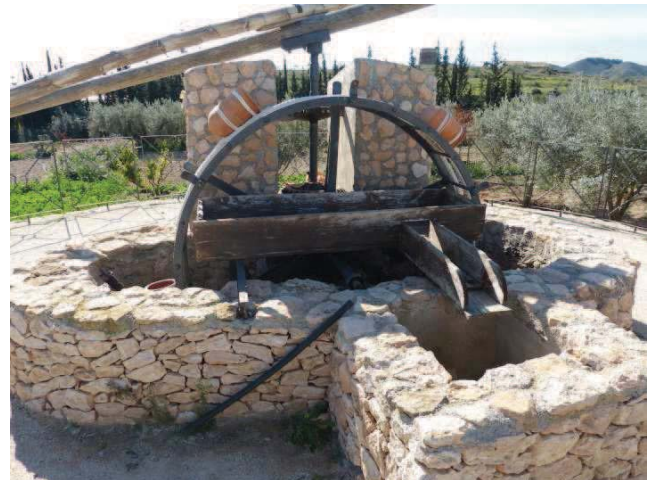
Foto 7. Noria de los Marines.

Otro de los elementos típicos de la etnografía del campo de Cartagena consiste en las denominadas Norias de Sangre, o Ceñas. Este tipo de norias han sido utilizadas durante muchos años para la extracción de agua mediante animales que regaba los cultivos tradicionales de secano de la zona.