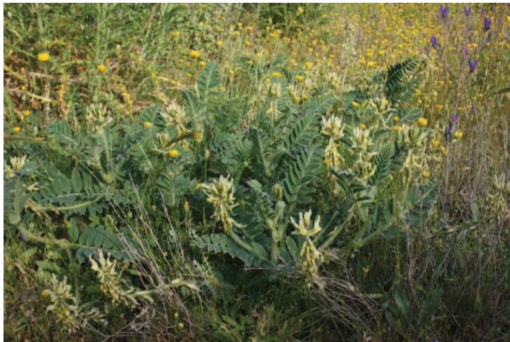
Foto 1. Ejemplar de Astragalus nitidiflorus de tres años de edad

Estas nuevas prospecciones mostraron que la especie presentaba un alto riesgo de desaparición, por lo que en junio de 2012 la comisión Europea financió el proyecto LIFE11/BIO/ES/727 'Conservación de Astragalus nitidiflorus en su hábitat potencial en la Región de Murcia', proyecto que tiene prevista su culminación en junio de 2016. Esta iniciativa se centra en la recuperación y conservación del Garbancillo de Tallante en la Región de Murcia para garantizar así la supervivencia a largo plazo de esta especie.